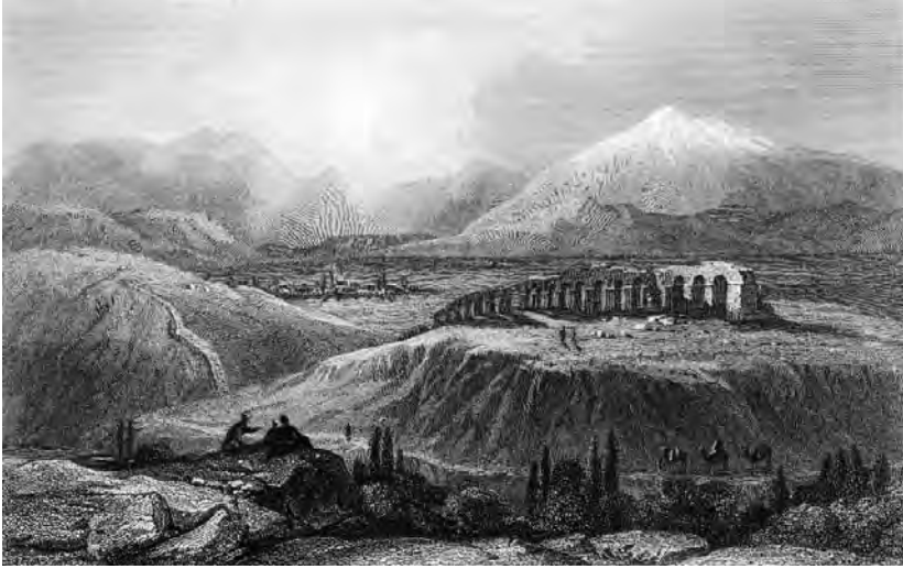
Antiocheia Gravürü

merkezleri; Agrai (Atabey), Sidera (Bayat), Apolbuia (Uluborlu), Antiocheia (Yalvaç), Adada (Sütçüler), Neapolis (Şarkikaraağaç) ve Dabena (Gelendost)'dir. Bahsi geçen merkezlerden, Hellenizm'in son dönemlerinde kurulan Antiocheia (Yalvaç), Romalılar devrinde büyük bir önem kazanmıştır 35 .