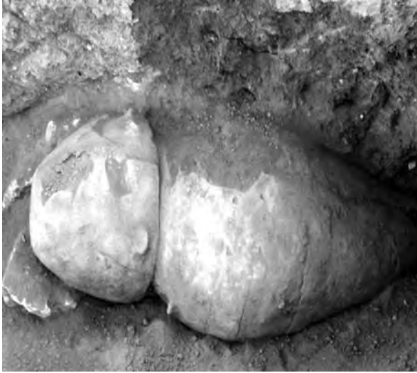
Harmanören Kazısında Bulunan Küp Mezar

Isparta'nın ilkçağlardaki tarihi, daha ziyade Pisidya bölgesinin genel tarihi seyri içinde incelenmelidir. Anadolu'nun tarihi ve uygarlığı ile yakından ilgisi olan Pisidya çevresi, Anadolu'da cereyan eden büyük siyasi olaylarda rol oynamış ve bu bölge tarihte değişik medeniyetlere ev sahipliği yapmıştır. Eldeki verilere göre, şehrin bulunduğu yerin Hititler'in Arzava ülkesine dahil olduğu anlaşılmıştır. Tarihî dönemlerde Hitit egemenliği altında olan bu bölgeye daha sonra İyonlar ve Lidyalılar hakim olmuşlardır. Bölgedeki şehrin tam olarak teşekkülü de Lidyalılar zamanında gerçekleşmiştir. M.Ö. 546 tarihinde Pers kralı, yapılan bir savaş neticesinde Pisidya yöresini Pers egemenliğine katmıştır. M.Ö. 333 tarihinde de Büyük İskender Likya'yı zabdederek Pers hükümlerine son verdi ve Pisidya'yı da ele geçirmiş oldu. İskender İmparatorluğu'nun yıkılmasından sonra bölge, Selevkoslar'ın hissesine düştü. M.Ö. 190 yılında Selevkoslar, imparatorları III. Antiochus'un başkanlığında, Batı Anadolu egemenliği rekabeti sebebiyle Manisa yakınlarında Romalılar'la karşılaştılar. Ağır bir yenilgi sonucu Selevkoslar bu bölgeyi Romalılar'a devretmek zorunda kaldılar 34 .