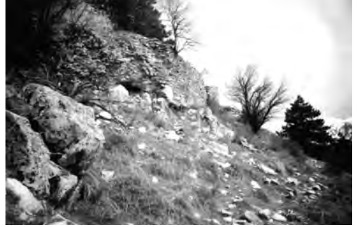
Isparta Kalesi Kalıntıları

Isparta, Göller Bölgesi'nde yer aldığı için sınırları içerisinde irili ufaklı birçok göl mevcuttur. III. jeolojik zamandaki kıvrımlarla yükselmiş, daha sonra volkanik ve tektonik hareketlerle yeni şekiller kazanan il alanında sayısız çukurlar oluşmuştur. Bunlardan bazıları bugün ova şeklinde olup tarım alanı olarak kullanılmış bazıları da zamanla suyla dolarak göller meydana gelmiştir. Bu sebeple bölgeye “Göller Bölgesi” adı verilmektedir 10 . İl sınırları içerisindeki göller Eğirdir, Kovada, Gölcük gölleridir. Ayrıca Beyşehir ve Burdur göllerinin küçük bir bölümü de il sınırlarının dahilindedir.