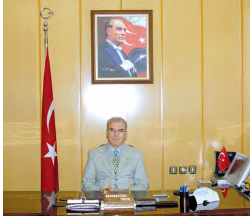
Şemsettin UZUN Isparta Valisi