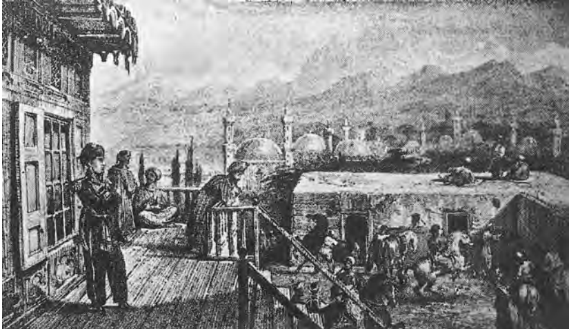
Isparta Gravürü (Ün Dergisi)

Isparta adının kaynağı hakkında çeşitli görüş ve söylentiler bulunmaktadır. Bunları aşağıdaki şekilde sıralamak mümkündür: Yunanistan'da bulunan Isparta şehrinin milattan 330 sene evvel Büyük İskender tarafından zabdedilmesinden dolayı muharebe esnasında dağılan ahâlisi buralara hicret etmişler, dağlara ve dereler içine evler, tapınaklar inşa etmeleri sebebiyle yeniden şehir kurmuşlar ve buraya daha önce yaşadıkları şehrin ismini vermişlerdir 26 .