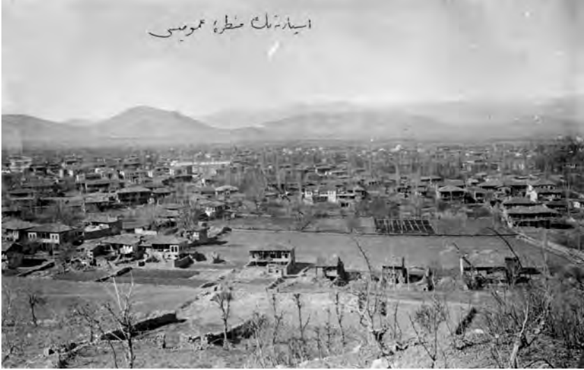
Isparta'nın Manzara-i Umumiyesi

Isparta, doğuda Torosların bir kolu olan Davraz Dağı (2635 m.), güneyde Kundaklıbe, Sidre (1640 m.), Karatepe (1650 m.), batıda Hisar Tepesi (1580 m.) ve Gölcük Tepeleri, kuzeyde Kayı ve Çünür tepelikleri ile çevrilmiş ve güneydeki tepe ve dağlara daha yakın, güneyden kuzeye doğru hafif meyilli bir düzlük üzerinde yer almaktadır 2 .