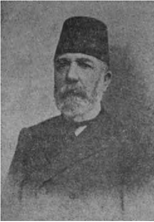
Böcüzade Süleyman Sami

Böcüzade Süleyman Sâmî Efendi (1851-1932) 19 Isparta Tarihi adlı eserinde Isparta'ya gülcülüğün 1890 yılında geldiğini söylemektedir. Bulgaristan'a bağlı Kızanlık yöresinden bir zattan, Muhâsebe Başkâtibi İsmail Efendi'nin öncülüğünde başladığını, yerli imbiklerle çekilen gülyağının kaliteli olduğu anlaşılınca, 8-10 sene içinde Isparta'da birkaç bin dönüm gül fidanı dikildiğinden bahsetmektedir 20 . Isparta'ya gülün ilk olarak gelmesine vesile olan ve ilk gülyağı çıkarımını yapan İsmail Efendi'dir. Bundan dolayıdır ki sonradan kendisine Gülcü İsmail İsmail Efendi denmiştir. İsmail Efendi, Isparta'ya bağlı Yalvaç İlçesi eşrafından Meydan Bey oğlu Mehmet İzzet Efendi'nin oğludur. 1256 (1840) yılında Isparta'da Hacıyavaz (Hacıyavaz) Mahallesi'nde dünyaya gelmiştir.