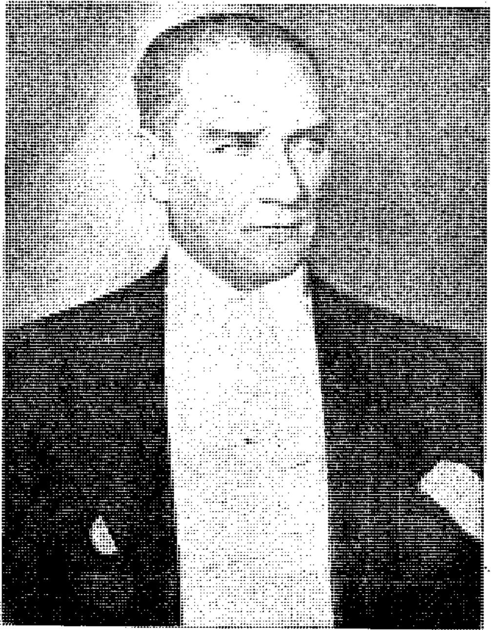
Bir sene evvel (10 İkinci Teşrin 1938 Saat dokuz, beşde Ebediyete intikal eden Sevgili Atatürk